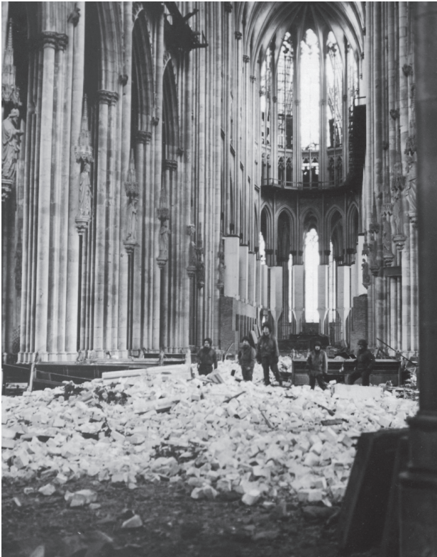
Abb. 2: US-Soldaten im Kölner Dom, 6.4.1945.